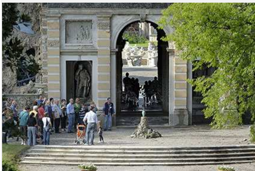
Visita al Ninfeo di Villa Litta

' Ninfeamus - Dire, fare, sbocciare ', l'appuntamento annuale dedicato alla promozione della cultura del verde e alla natura di Villa Borromeo Visconti Litta di Lainate (Milano) è pronto ad aprire i battenti. Dal pomeriggio di venerdì 25 aprile e per l'intero fine settimana, la cinquecentesca villa ospiterà non solo l'esposizione e vendita di piante e fiori, oggetti artistici e cibi naturali ma anche un articolato programma di spettacoli, mostre, workshop, laboratori per bambini e possibilità di praticare sport all'aria aperta. Completano l'offerta le visite guidate allo splendido Ninfeo , edificio di fine '500, costituito da stanze completamente decorate a mosaico di ciottoli bianchi e neri e ciottoli dipinti a tempera, con i suoi caratteristici giochi d'acqua, e al Parco storico della Villa.