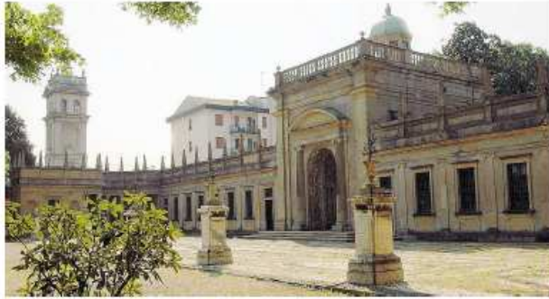
Il ninfeo, una tra le maggiori attrazioni del parco storico dell'antica dimora lainatese

LAINATE (osr) Il parco di Villa Litta sarà il primo in Italia davvero «green». È al via infatti Eco-zona, un progetto pilota, primo nel suo genere nel nostro Paese, per la manutenzione di un parco storico a emissioni zero. Il progetto prende in considerazione non solo ciascuna lavorazione tradizionale collegata alla manutenzione del verde, «reinterpretandolo» nell'ottica dell'abbattimento delle emissioni di anidride carbonica, ma anche l'impatto acustico - e in alcuni casi persino visivo - della lavorazione. I tagli dell'erba, le potature e tutte le operazioni di manutenzione nel Ninfeo saranno svolte con attrezzi elettrici (decespugliatori, soffiatori, motoseghe...) alimentati a energia solare, mediante una stazione con pannelli solari fotovoltaici destinati alla ricarica delle apparecchiature. La stazione di ricarica è realizzata con materiali riciclati, certificati «plastica seconda vita». La logica «km zero» è attuata anche nella gestione degli sfalci e non solo: tutti i materiali di risulta di po-