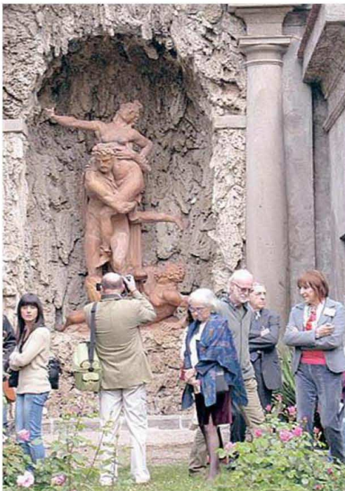
ANIMA GREEN Il parco di Villa Litta diventerà una Eco-Zona dove, novità per l'Italia, ogni processo sarà rigorosamente a impatto inquinante nullo