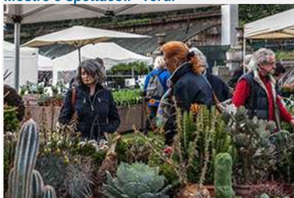
L'esposizione di piante.