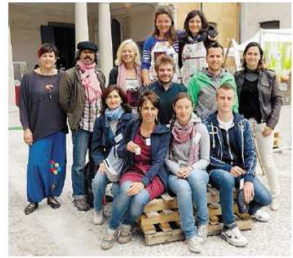
Gli autori del Miglior allestimento temporaneo nel concorso riservato agli adulti

VILLA LITTA Prosegue la collaborazione con l'istituto Kandinsky di Milano, mentre il Ninfeo e i Palazzi riaprono al pubblico