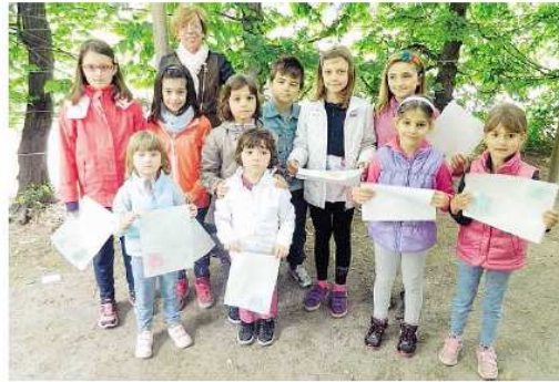
Alcuni dei bambini che hanno partecipato alla visita botanica, scoprendo alberi, fiori e specie animali

LAINATE (bnd) Rispettare l'ambiente, compiere piccoli e semplici gesti per ridurre gli sprechi, riciclare gli oggetti: sono tutti accorgimenti che contribuiscono a salvaguardare la natura e la nostra salute. Lo sanno bene i bimbi che hanno partecipato alla terza edizione di Ninfteamus, ospite a Villa Litta di Lainate dal 25 al 27 aprile.