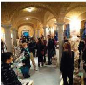
Visitatori tra le opere del Rho design days

Tra qualche polemica ( http://rho.milanotoday.it/gente-rho-critica-design-days-17-aprile-2013.html ) è calato il sipario sul Rho design days , ma la polvere non ricoprirà i lavori realizzati dalle scuole superiori, esposte nelle sale di villa Burba. Anzi: tutte le opere esposte durante i giorni del design rhodensi troveranno spazio nelle sale di villa Litta, in occasione del Ninfeamus che si svolgerà da sabato 20 aprile.