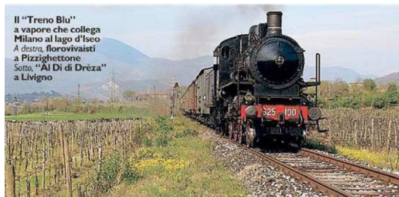
Il "Treno Blu" a vapore che collega Milano al lago d'Isèo A destra, florovivaisti a Pizzighettone Sotto, "Al Di di Drèsa" a Livigno

TORNIAMO nel Bresciano, esattamente a Rovato , per la rassegna "Tra rose, storia e leggenda" che si rinnova ogni domenica (fino a novembre) all'ombra dell'antica dimora del XV° secolo e del giardino circostante, fra ortensie, 1500 varietà di rose, angoli verdi segreti, uno spazio green bioenergetico e un piccolo "orto dei semplici" (Ingresso alle 11 e alle 16. Costo: 8 euro. Info: www.castelloquistini.com ). Infine, in tutt'altra zona, c'è chi onorerà la primavera in modo insolito: buttandosi nell'acqua... gelida. E se l'effetto visivo è quello di un mondo nordico che richiama Finlandia e Svezia, la realtà supererà la fantasia. Domenica 21, Livigno festeggerà "Al Di di Drèsa", evento dai contorni improbabili e spettacolari, che prevede appunto l'attraversamento di una pozza d'acqua gelata (18 metri di lunghezza, 12 di larghezza e 1,6 di profondità). Come? Con i mezzi a disposizione: monosci, snowboard, carri goliardici e quant'altro.