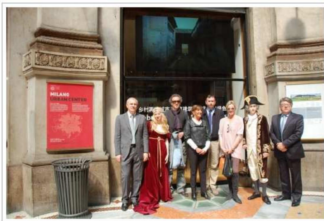
I realtori della presentazione del ricco calendario di Villa Litta 2013 posano all'Urban Center in Galleria Vittorio Emanuele a Milano