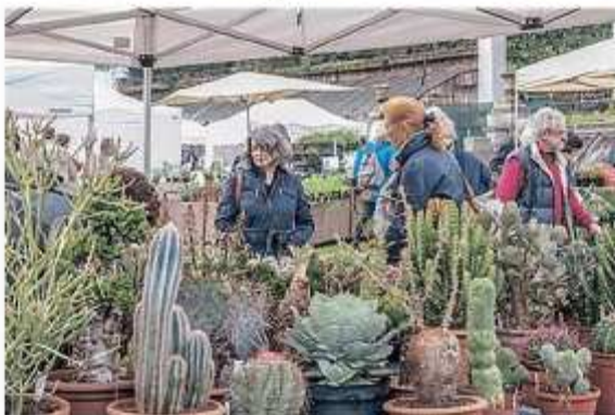
NON SOLO FIORI Piante curative e corsi su come usarle in cucina.